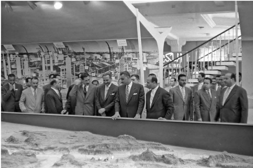
زيارة معرض البترول العربي بالجزيرة ٢٣/٤/١٩٥٩